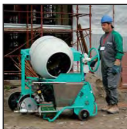
Alimentada por una hormigonera (morteros tradicionales)