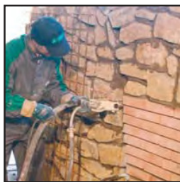
La SMALL 50 MULTIUSOS, es ideal también para hacer rellenos de juntas, inyecciones, proyección de impermeabilizantes, e incluso para acabados finos y pinturas