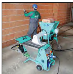
Alimentada por un mezclador continuo (morteros premezclados)