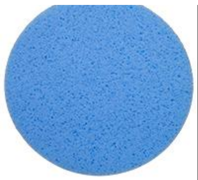
Discos de esponja Ø 350 mm azul