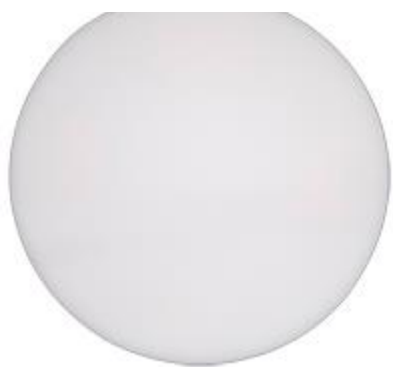
Discos de esponja extrafina Ø 350 mm