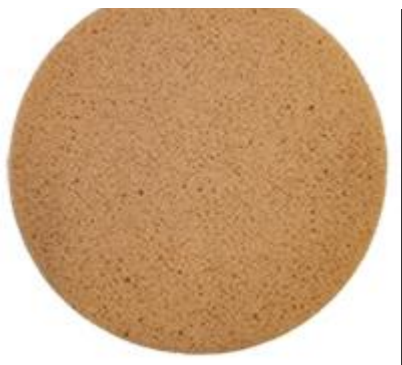
Ø 350 mm Discos de esponja marrón