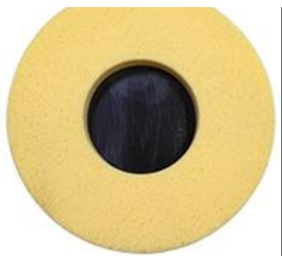
Anillo esponja Ø 350 mm STRUCTURA Hydro