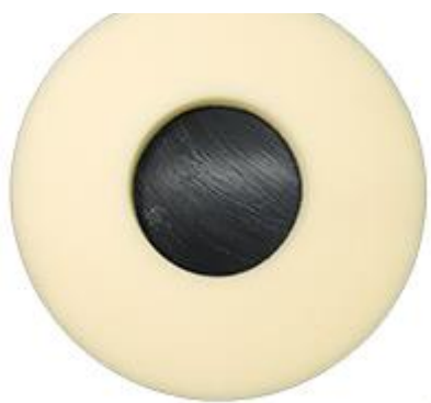
Anillo de esponja Ø 350 mm LEMON Hydro